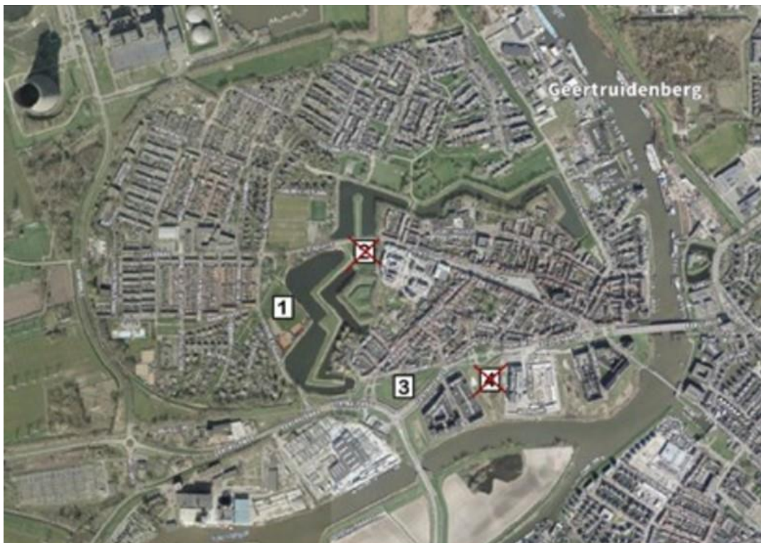
De beoogde locaties voor de nieuwbouw

Op dit moment ontbreekt ieder draagvlak voor het realiseren van een supermarkt binnen het Beschermd Stadsgezicht Geertruidenberg, gezien alle reacties die op dit moment "binnen" komen, via social media en andere bronnen! De fractie Lijst Smit had daar eerder, tijdens de presentatie voor gewaarschuwd! Vraag: Kan het college zich nu niet beter focussen op de (on)mogelijkheden van uitbreiding van de supermarkt op het Schonckplein, omdat daar nu alleen nog een mogelijk draagvlak voor is? Zo besluiten beide fracties.