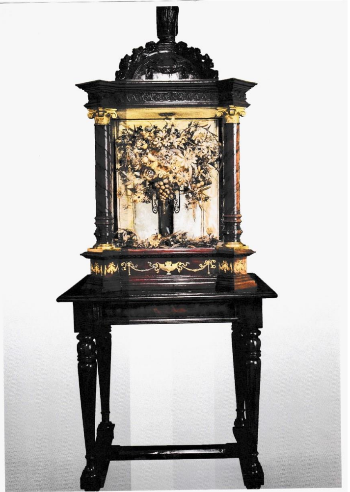
Een afbeelding van het haarkabinet

In het openbaar geworden archief van het Militair Gezag, 1944 – 1946, vinden we in stukken van de ‘Oud Illegale