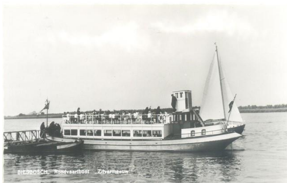
De Zilvermeeuw

Een rondvaart in Nationaal Park De Biesbosch is een echte beleving. Onze rondvaartboten zijn speciaal gebouwd om vaartochten door dit voormalig getijdengebied te maken.