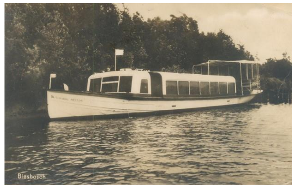
Rondvaart Werkendam Admiraal Nelson Maasdam