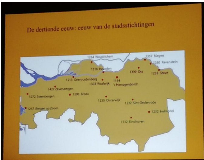
Enkele dia's en foto van deze avond