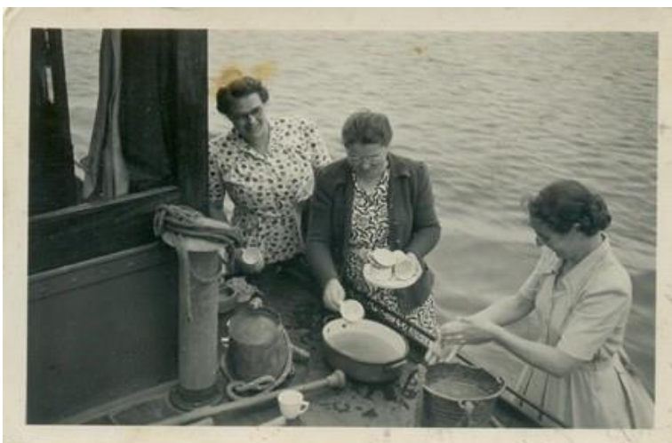
Afwas in de Biesbosch

Cees Schuller vervolgt: "Er heeft nog lang een omgebouwde luxe motor gevaren, een schip dat 's zomers de rondvaarten deed en 's winters in hetzelfde gebied werd ingezet als vrachtschip.