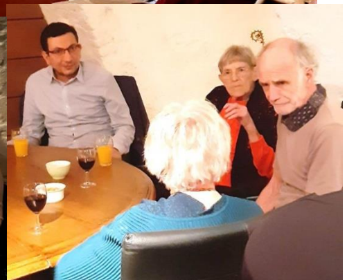
Vervolg op pagina 4