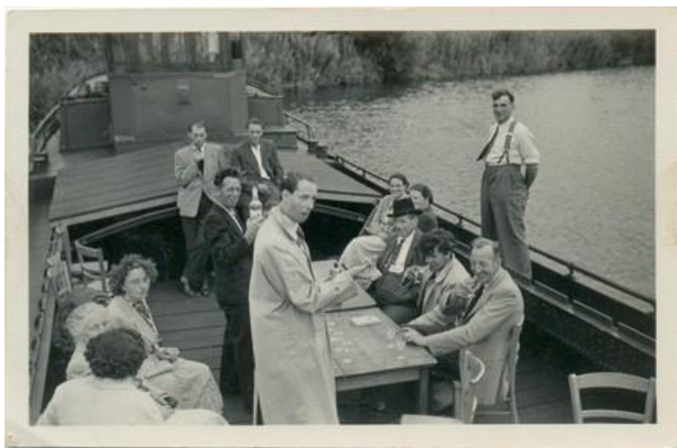
Drimmelen Hoop op Welvaart

Het is Cees Schuller gelukt, naast een bijzonder stuk geschiedenis, een groot aantal afbeeldingen boven tafel te krijgen. Werde vroeger de afwas aan boord van de rondvaartboten in het gangboord gedaan, tegenwoordig gebeurt dat op een heel andere manier. Het belooft een bijzondere lezing te worden. Niet alleen voor de liefhebbers van de Biesbosch, maar ook voor degenen die geïnteresseerd zijn in regionale maritieme geschiedenis. (Jan Hoek)