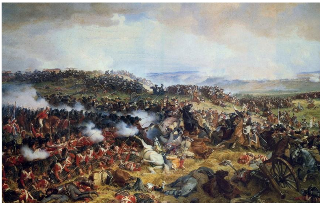
Een Brits carré slaat de Franse cavalerie af