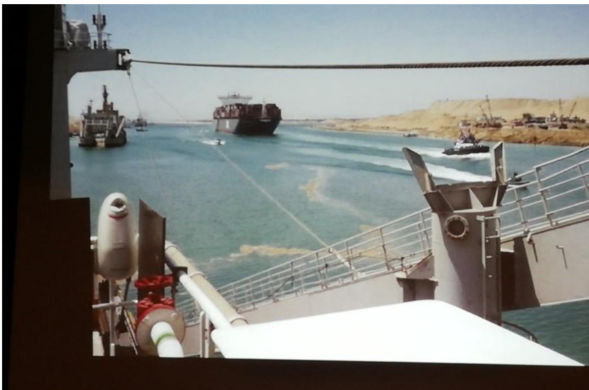
De baggerwerken in het Suezkanaal

Sliedrecht. Het zal niemand verbazen dat ze een ieder die meer wil weten over de geschiedenis van het baggeren een bezoek te brengen aan dit museum. Het in een prachtig historisch pand gevestigd museum beschikt over een bijzondere collectie. Sinds 2015 is er in de ruim 1200 m2 grote tuin van het Baggermuseum over een interactieve Baggerpraktijktuin voor jong en oud met in totaal zestien werkstations. Daarmee kunnen de deelnemers ervaren welke technieken er gebruikt worden in de waterbouw en specifiek op het gebied van baggeren. Voor meer informatie: www.baggermuseum.nl . (Jan Hoek).