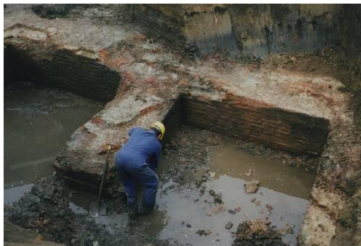
Illustraties Bron Bas Zijlmans

Om te voorkomen dat de waardevolle funderingen van het kasteel onder het zichtveld zouden blijven en daardoor opnieuw in de vergetelheid zouden raken, werd het plan opgevat een deel van het kasteel bovengronds op te bouwen. In 2017 zijn de eerste stappen ondernomen om steun voor het plan te krijgen. Nu, twee jaar later, zijn de plannen in een vergevorderd stadium en lijkt het erop dat nog dit jaar begonnen kan worden met de realisatie van het opbouwplan.