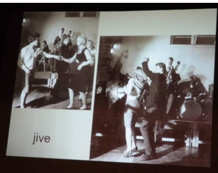
Enkele sheets uit de presentatie tijdens de lezing

Graag zien we u terug op de volgende lezing op donderdag 18 april.