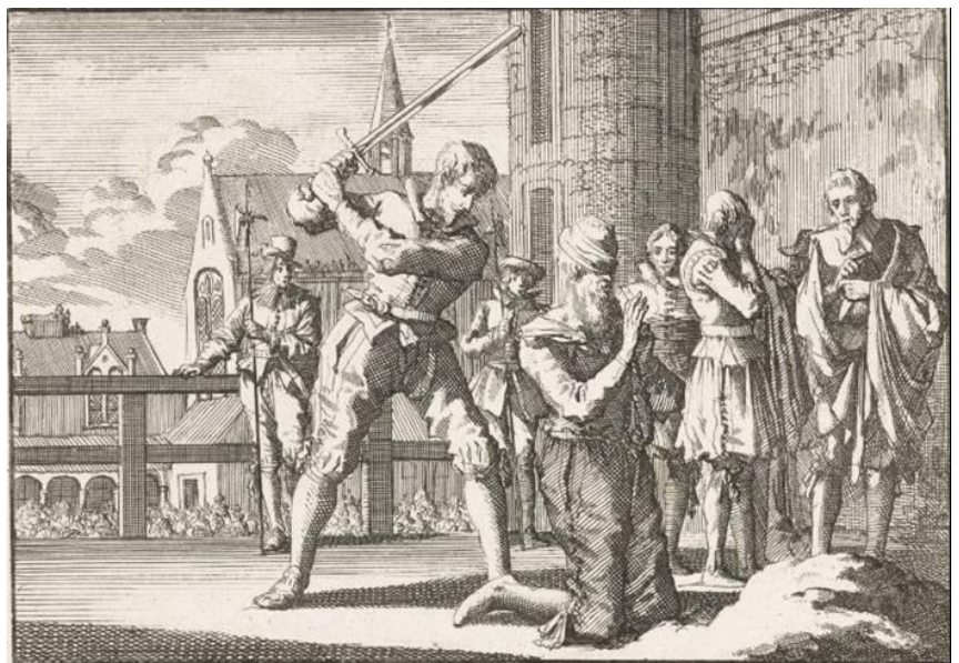
Onthoofding van Johan van Oldenbarnevelt Jan Luyken ca 1696 Rijksmuseum

De terechtstelling op het Binnenhof van Johan van Oldenbarnevelt wordt gezien als een zwarte bladzijde in de Nederlandse geschiedenis. Het proces en de executie spre-