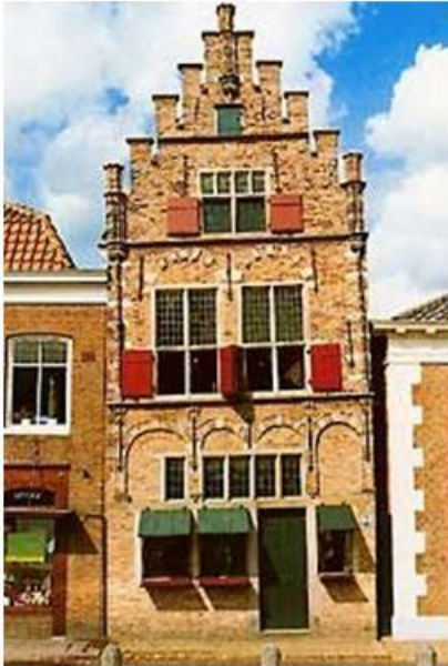
Het Museum Edam uit 1550

De andere helft van ons gezelschap ( Groep B) start met een bezoek aan het 50 meter verder gelegen Stadhuis van Edam uit 1737. In het Stadhuis doet één verdieping dienst als dependance van het Museum. Op beide locaties is geen lift aanwezig maar een korte opgang via een trap.