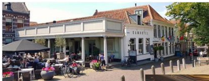
Het Restaurant L'Auberge Damhotel

In een comfortabele touringcar, van het Touringcarbedrijf Brabant Express, rijden we naar Edam. De bus arriveert op de parking bij de St Nicolaaskerk aan de Grote Kerkstraat 59. (Van hieruit vangt ook de terugreis naar Geertruidenberg aan.) Vandaar maken we een korte wandeling naar het chique restaurant L'Auberge Damhotel in het centrum van Edam. Daar starten we onze excursie met 2 lekkere kopjes koffie of thee met gebak.