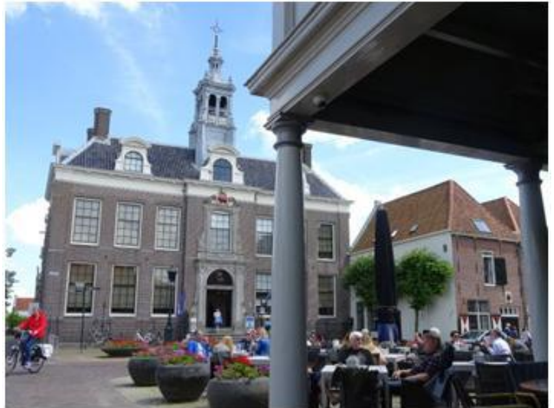
Het Stadhuis van Edam uit 1737

Na afloop van deze activiteiten is er nog tijd voor b.v. een bezoekje te brengen aan de St Nicolaaskerk welke gevestigd is aan de Grote Kerkstraat 59 of een terrasbezoekje, of een Edammer kaasje kopen .