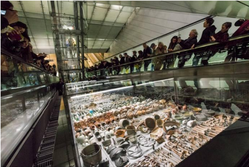
Onthulling vitrines met archeologische vondsten, metrostation Rokin.

Over de hobbels die zijn genomen hoeven we het eigenlijk niet meer te hebben. Van budgetoverschrijdingen en huisverzakkingen tot opgeheven bus- en tramhaltes, ze hebben niet bepaald bijgedragen aan de 'verbinding' waar de gemeente zo op uit was. Maar nu is het eindelijk zover: tussen het snelle zakendistrict van de Zuidas en Amsterdam-Noord resten slechts zestien metrominuten. De bankier en de business consultant forenzen 's ochtends vanaf hun gloednieuwe penthouse aan het IJ in Noord in één ruk naar kantoor, terwijl... Wacht, wie wil die vlucht noordwaarts eigenlijk maken, naar het Buikslotermeerplein of de Vogelbuurt?