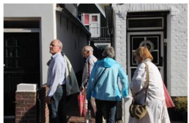
met smalle steegjes (Ginkies)