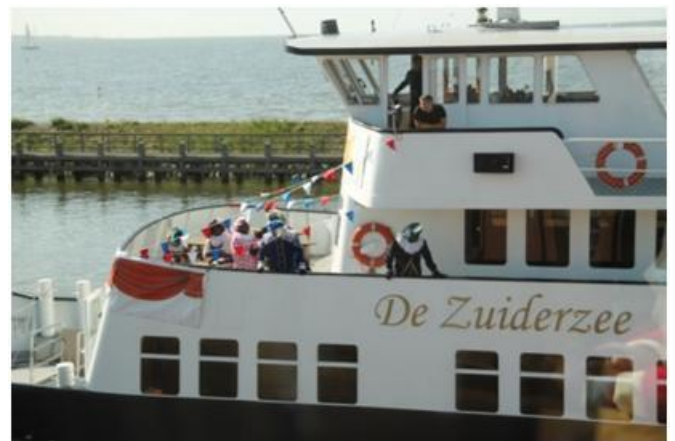
Stoomboot uit Spanje ??

Tijdens de lunch ontstond nog grote hilariteit, op het IJsselmeer was een boot werd gespot waarop, je gelooft het niet, Sinterklaas en Zwarte Piet aan dek stonden. Waren ze te vroeg of de weg kwijt? Uit onderzoek bleek dat het opnames betrof voor een speelfilm.