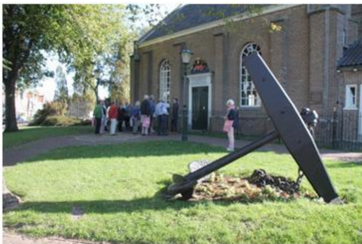
Één van de 20 kerkjes

De deelnemers werden door heel pittoreske straatjes en steegjes (sommige niet breder dan 75 cm) geleid, terwijl sappige verhalen over het vroegere leven 'op Urk', door de gidsen werden verteld. De wandeling ging uiteraard ook langs een van de 20 kerkjes van Urk.