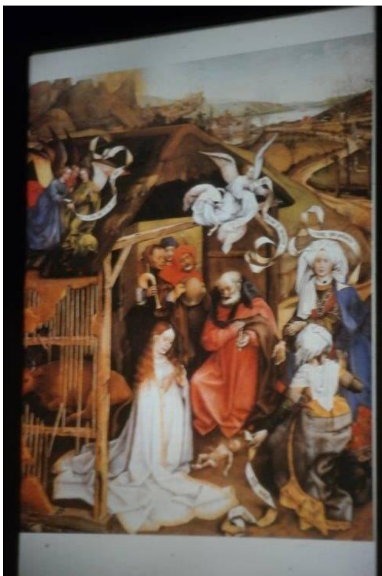
Een van de vele getoonde dia's

Hierna begon hij aan zijn uitleg en gebruikte hiervoor het onbekende evangelie van Jacobus. Hij noemt dit evangelie niet gecanoniseerd. Het is dus niet tot norm verklaard. Dit evangelie is net als de andere zo'n 100 jaar na Christus geschreven. Hij stelde de conceptie aan de orde, waarom er een os en een ezel in de voorstelling terecht kwamen en hoeveel koningen er bij de kribbe zijn geweest.