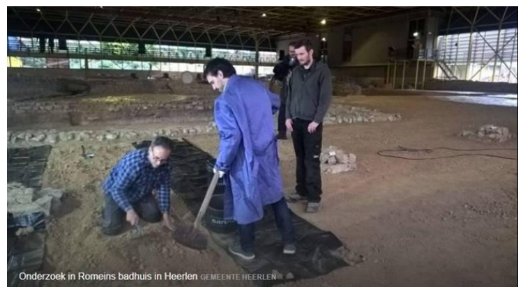
Onderzoek in Romeins badhuis in Heerlen GEMEENTE HEERLEN

Ontleend aan Website NOS maandag, 16:46 regio