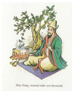
Shen Nung, rustend onder een theestruik

Datum: donderdag 16 maart 2017 Spreker: Arie Niks Locatie: Theaterzaal van Cultureel Centrum 'De Schattelijkj' Tijd: 20.00 uur