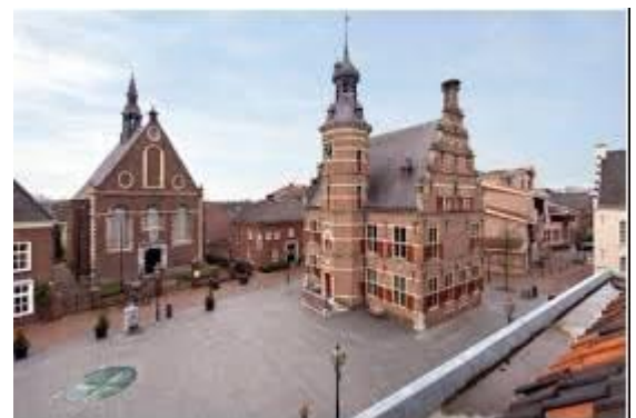
Op de foto stadshuis en gereformeerde kerk te Gennep