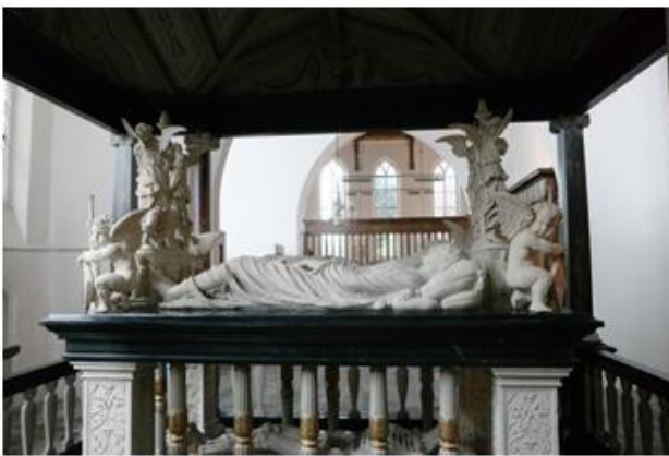
Het curieuze praalgraf van Reinoud III van Brederode en zijn vrouw Philippote van der Marck

In de kerk bevindt zich een van de mooiste en zeker meest curieuze praalgraven in Nederland: het graf van Reinoud III van Brederode en zijn vrouw Philippote van der Marck. Het wordt toegeschreven aan de toen in Utrecht werkzame beeldhouwer Colijn de Nole en dateert van omstreeks 1540.