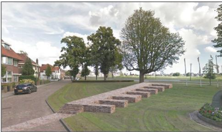
Afbeelding 2.