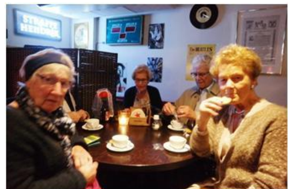
Gezellige nazit in De Rode Reiger.

Na afloop van de bezoeken, was er nog een vrij te besteden uurtje. Gezien de weersomstandigheden doken de meeste deelnemers snel naar binnen in het etablissement 'De Rode Reiger' een leuke kroeg, voor 'n gezellige keudel bij een warme kachel, met een goed glas wijn/ bier of andere versnapering. Om 17.00 uur verzamelde iedereen zich weer bij de klaarstaande touringcar en werd voldaan de thuisreis aanvaardt.