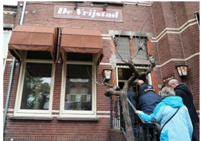
Restaurant De Vrijstad