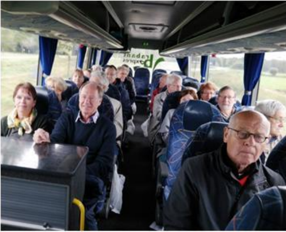
De reis kan beginnen