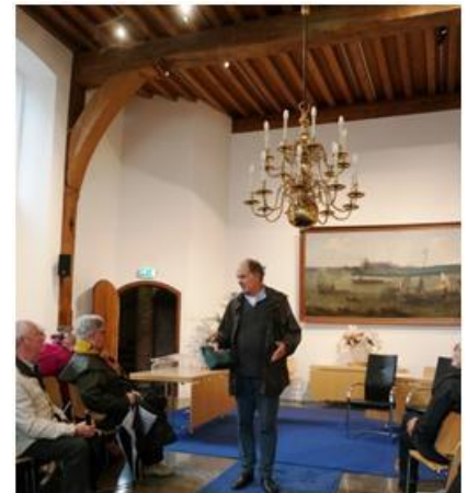
Trouwzaal van het stadhuis

Ook de Grote Kerk aan de Voorstraat was het bekijken waard. Deze kerk is rond 1400 gebouwd door het geslacht Van Brederode, als gebouw voor de eredienst en ter illustratie van de grootsheid van hun macht. De kerk is een rijksmonument.