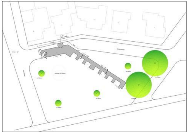
Afbeelding 1.

De artist's-impression is ook ter beoordeling, voorgelegd aan de Gemeentelijke Monumentencommissie, welke het plan positief