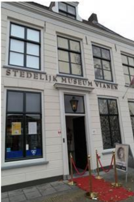
Het Stedelijk Museum

( N.B. geïnteresseerden kunnen deze boeken inzien via het OKG secretariaat 0162-515569 )