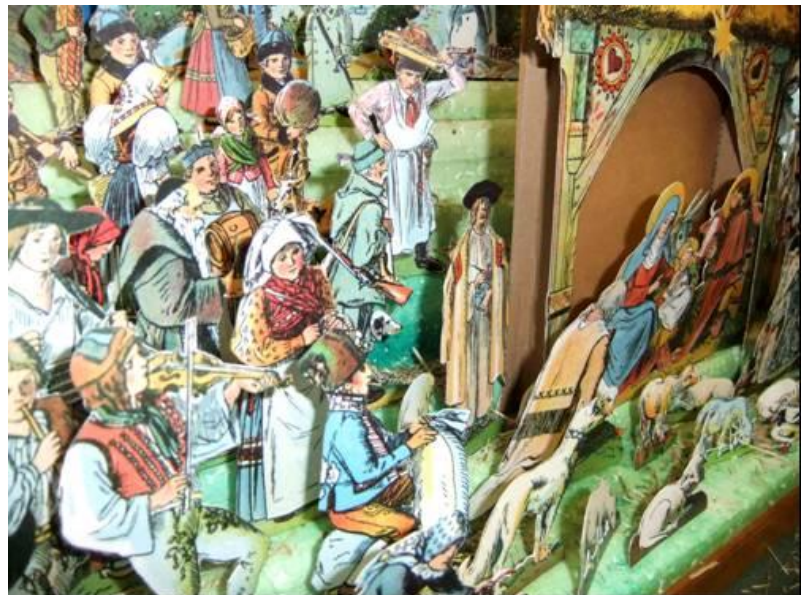
Afbeelding 7 - Napolitaans fragment -

Tekst: Harrie Schalken, grafisch museum "In den groenen zonck", Wouw; Foto's: Toon Timmermans.