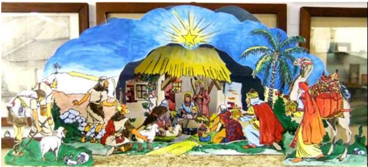
Afbeelding1. - coulissekerststal -

De coulissekerststal: een kijkdoosachtig mini-theatertje, toneelachtig, bestaande uit een aantal rechthoekige kaders die achter elkaar zijn gezet. Doordat de opening van elk volgend kader steeds een stukje kleiner is, ontstaat een dieptewerking.