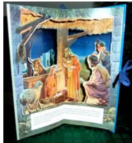
Afbeelding 5 - carrouselboeken, Engels en Nederlands -