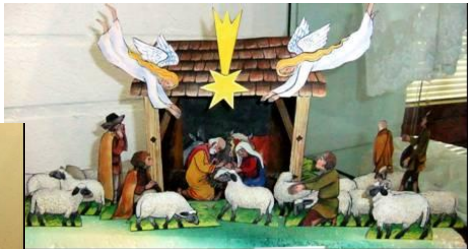
Afbeelding 2. decor-opzet kerststal

De décor-opzetkerststal: in de vrije ruimte los geplaatste figuren op een voorvlak, met de stal en/of het landschap als achtergrond.