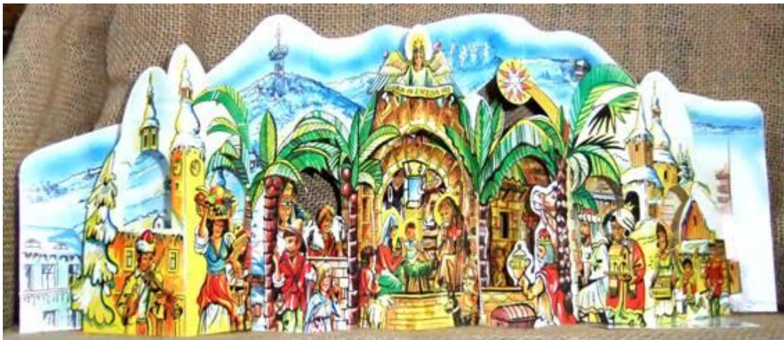
Afbeelding 4. - leporello – of harmonica-boek

Een leporello of harmonica-boek: een uittrekbare zigzagconstructie. In de opera Don Giovanni van Mozart trekt de knecht van Don Juan, Leporello, op een bepaald ogenblik een harmonica-boek open met daarin afbeeldingen van alle jonge dames die zijn meester heeft veroverd; vandaar die naam.