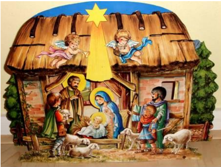
Afbeelding 6 - kinderkerststal -

Binnen dit kader bestaan er stallen in traditioneel gotische, neogotische, classicistische of neoklassieke vormgeving, barokke vormgeving, duidelijk afgeleid uit die historische stijlen en vormgevingsconcepten.