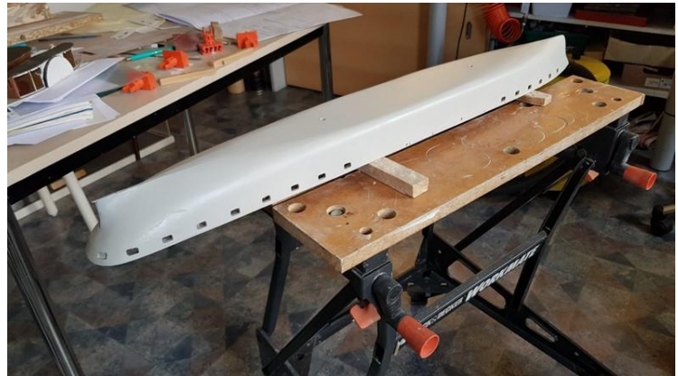
Nu kunnen de ramen voorzien worden van Plexiglas die Jac al had gemaakt.