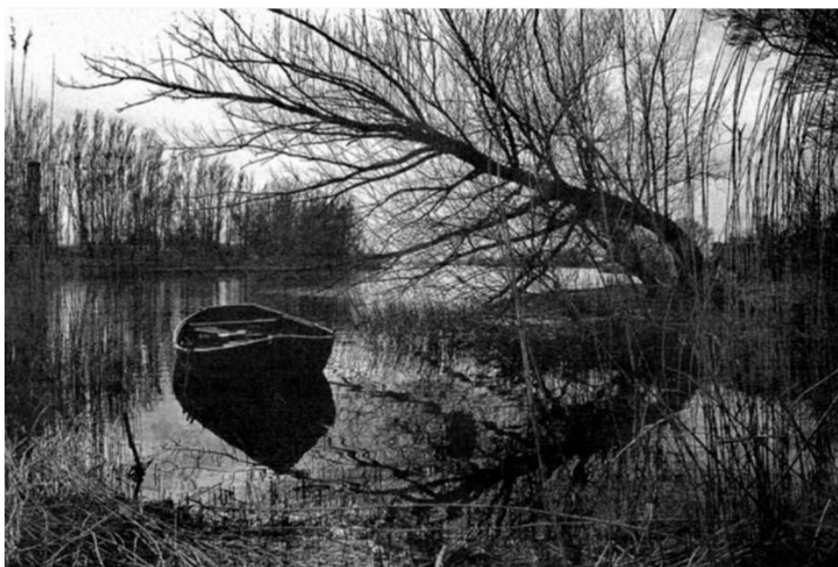
In bruikleen van: Cees Schuller en Cees Achten