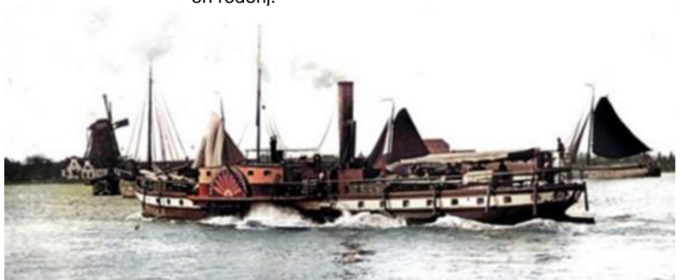
Stad Geertruidenberg II

De voorganger van dit schip, de Stad Geertruidenberg I, had in 1849 een belangrijke rol, het vervoerde het stoffelijk overschot van koning Willem II van Geertruidenberg naar Rotterdam (Bron: boek over de Thor).