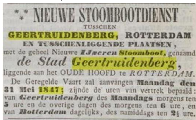
advertentie van het in de vaart komen van de 'Stad Geertruidenberg I'