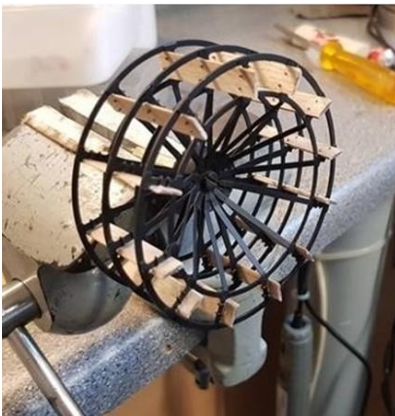
de raderen klaar, compleet met de voortstuwingsplanken

echt niet hoe het precies in elkaar zat. Doch door logisch nadenken kwamen we tot de conclusie dat het zoiets geweest moet zijn. Een draagconstructie voor de boegspriet, die bekleed is met schootjes.