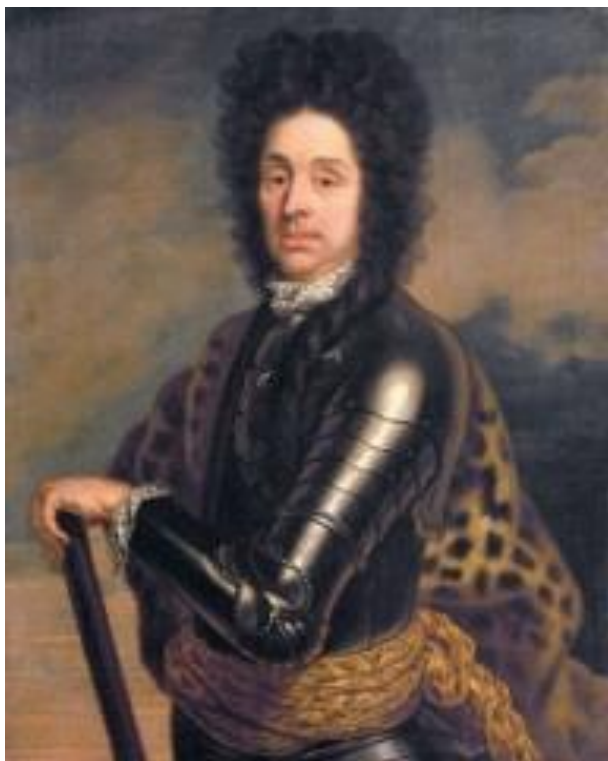
Menno van Coehoorn

Als hij in 1704 sterft, zijn slechts een paar van zijn werken voltooid.