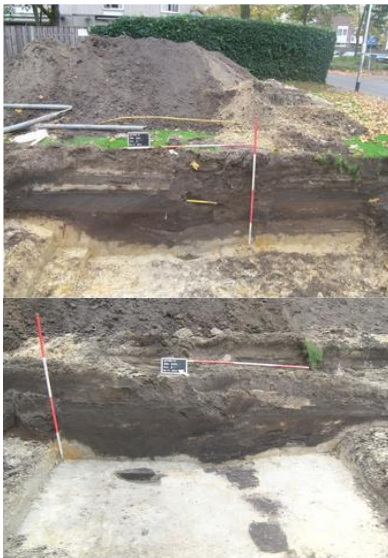
Profielen van de liniegrachten

http://erfgoed.breda.nl/media/spinola600dpi.pdf