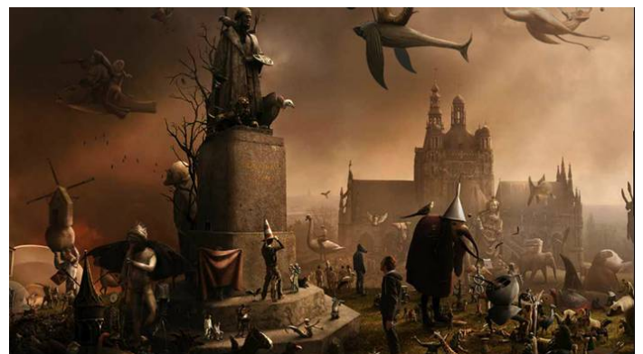
Ontleend aan Brabant Magazine 20

7 Brabantse musea bundelden hun krachten voor de Bosch Grand Tour. Met onder meer het videodrieluik 'The Fish Pond Song' van Jeroen Kooijmans in het Stedelijk Museum 's-Hertogenbosch, de expositie 'De dieren van Jeroen Bosch' in het Natuurmuseum in Tilburg en een overzichtstentoonstelling in het Noord-Brabants Museum, de grootste Bosch-expositie ooit.