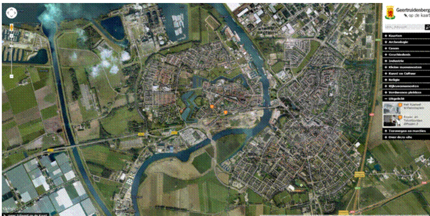
Afbeelding: openingsscherm Geertuidentberg op de kaart

'Kleine Monumenten' zijn er al in verwerkt maar dat is nog slechts het begin. Ook archeologie, geschiedenis, industrie, kunst en cultuur, personen, rijksmonumenten, verdwenen plekken etc. zullen nog in kaart worden gebracht. Uiteindelijk ontstaat een cultuurhistorische waardenkaart van enorme omvang en de websitebezoeker en/of app-gebruiker is straks slechts enkele muisklikken verwijderd van interessante