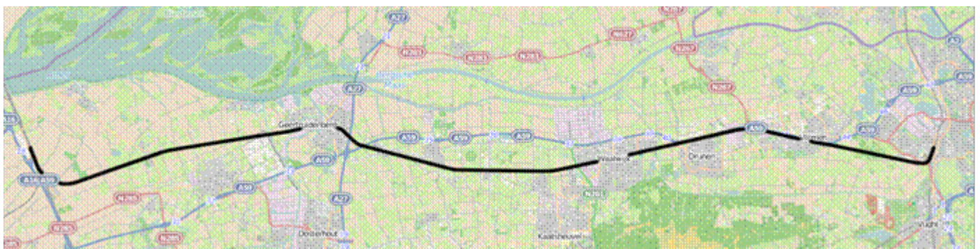
Afbeelding: Het spoortracé zoals de Langstraat oorspronkelijk dienst heeft gedaan