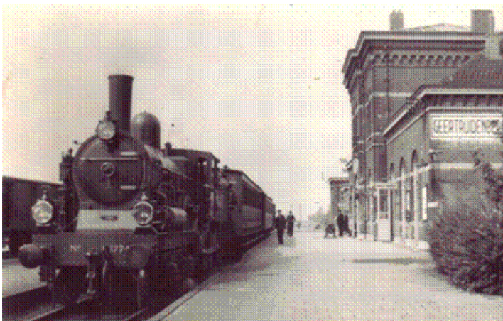
In de Foto: Het Station Geertruidenberg anno 1950

Vanaf deze plek wensen wij de werkgroep veel succes en kijken we uit naar het resultaat bij de opening. De tentoonstelling loopt van 27 juni t/m 13 september.