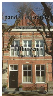
Foto: Kaft 'Panden en Standen, Elfhuizen 7' 144 pagina's, ISBN 978-90-814223-6-9