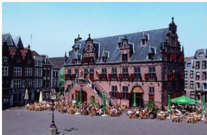
Het Waaggebouw op de Grote Markt

wat jonger dan het eerder genoemde Romeinse fort. In de binnenstad staan bijzondere historische gebouwen.