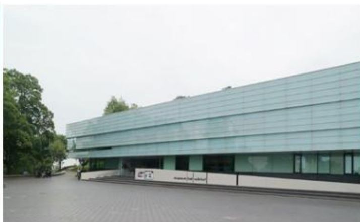
Museum Het Valkhof

De stadswandeling welke we door historisch Nijmegen maken is dan ook een reis door vele jaren geschiedenis