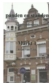
Markt 1. Afm. 24 x 15 cm Pagina's: 156

Of wat denkt U van de serie 'Panden en standen' van Geertruidenberg