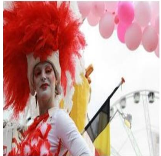
Fotobijlschrift: Roze Maandag 2011 door Anne-Marie van der Gouw (collectie Regionaal Archief Tilburg)

Daarom probeert Regionaal Archief Tilburg dit hedendaagse beeldmateriaal nu al in de collectie op te nemen. Als de archieven deze digitale foto's nu niet opslaan, zijn deze tijdsbeelden straks verdwenen. Het thema van het Stuk van het Jaar sluit aan bij de Maand van de Geschiedenis: Vriend & Vijand. Deze bijzondere foto geeft inhoud aan dat thema. De uitbundigheid van deze dag staat in contrast met de innerlijke strijd die homo-, bi- en transeksuelen soms voeren en ook in schril contrast met de soms moeizame maatschappelijk acceptatie van het 'anders' zijn. Roze Maandag is als een vriend, het plezier straalt ervan af, en als een vijand, want homohaat is geen gepasseerd station. Het archief in Tilburg verrast vriend en vijand met deze flamboyante keuze, waar de kleur vanaf spat.