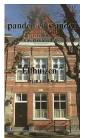
Elfhuizen 7. Afm. 24 x 15 cm Pagina's: 144