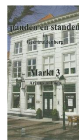
Markt 3. Afm. 24 x 15 cm Pagina's : 196