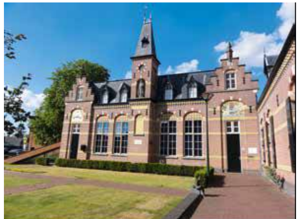
De voormalige Commanderie in Gemert

2015, worden de afgelopen twee eeuwen Noord-Brabant tegen het licht gehouden. Hoe homogeen is de huidige provincie? Zijn we allemaal dezelfde soort Brabanders? Is er zoiets als dé Brabantse identiteit? Er wordt hierbij gekeken naar streekdracht, architectuur en dialect. Er is hiervoor een zeer toepasselijke locatie: de voormalige Commanderie van Gemert! Meer informatie over de Dag van de Brabantse Volkscultuur, met een gedetailleerd programma voor de bijeenkomst in Gemert, volgt zo spoedig mogelijk via de communicatiekanalen van Brabants Heem en Erfgoed Brabant. Zet wel alvast deze dag in uw agenda! http://www.erfgoedbrabant.nl/portfolio/dag-van-de-brabantse-volkscultuur/