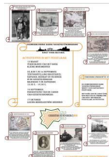
Raamposter met alle activiteiten van de Oudheidkundige Kring in het feestjaar

Geertruidenberg herbergt een rijke schat aan industrieel erfgoed dat het dubbel en dwars waard is, tentoongespreid te worden. De tentoonstelling zal ongetwijfeld voor u en de vele bezoekers een inspiratiebron vormen om herinneringen op te halen en met ons daarover te praten. U bent van harte welkom.