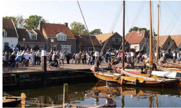
Bidders in de haven van Elburg

Noteer de datum alvast in uw agenda. In een volgende 'Mededelingen' ontvangt u nadere informatie over het programma en wijze van aanmelden. We bezoeken in elk geval het Bottermuseum en de Visafslag en maken zoals gebruikelijk een stadswandeling onder leiding van meerdere gidsen. Het belooft weer een gezellig en leerzaam historisch programma te worden met een gezellige koffietafel en lunch.