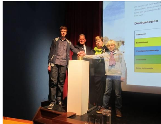
Lanceringsteam Canon