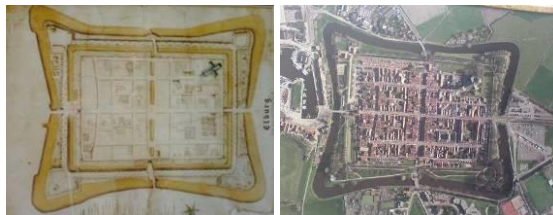
Elburg als ontwerp en een luchtfoto zoals het er nu uitziet

Elburg is een zeer oude plaats die in 1233 stadsrechten kreeg. Door de ligging aan de Zuiderzee waren er vaak overstromingen; de Marcellisvloed in 1362 deed de deur dicht. De hertog van Gelre, Willem van Gulick, gaf de opdracht om Elburg te verplaatsen.