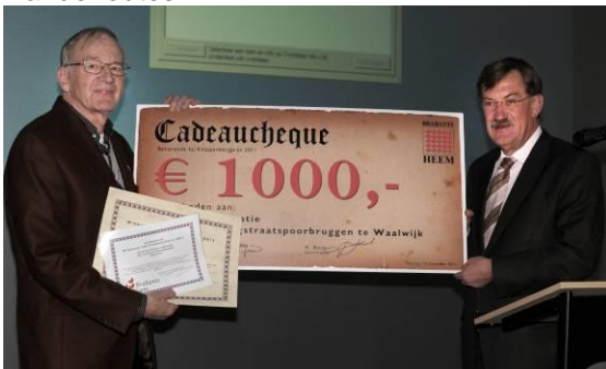
Voorzitter van Esch ontvangt de prijs

De Federatie Langstraatbruggen is uit deze drie genomineerden tot de gelukkige prijswinnaar uitgeroepen. In het oude tracé van de Langstraatlijn (ook wel Halve Zolenlijn genoemd) liggen een aantal spoorwegbruggen. In een aantal gevallen door en over interessante natuurgebieden, zoals de Moerputten bij Den Bosch. De Federatie verenigt een aantal plaatselijke werkgroepen en is er in geslaagd de bruggen voor de ondergang te redden en ze een nieuwe functie te geven als schakel in fiets- of wandelroutes.