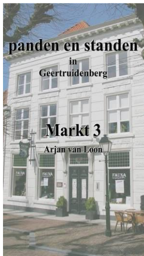
Foto: Kaft 'Panden en Standen, Markt 3' 196 pagina's, ISBN 978-90-814223-0-7