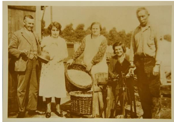
Familiefoto bij 'de Juin'