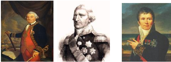
Johan Zoutman Jan Hendrik Kinsbergen Carel Hendrik Ver Huell