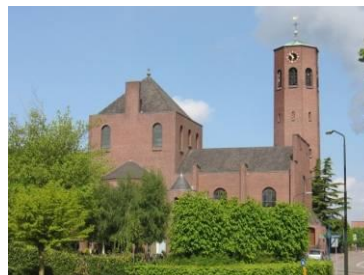
Onze Lieve Vrouw Hemelvaartskerk te Raamsdonksveer

In 2007 maakte toenmalig minister van OC&W Ronald Plasterk bekend om 100 bouwwerken uit de periode 1940-1958 voor erkenning als rijksmonument voor te dragen. De meeste objecten in deze Top 100 zijn daadwerkelijk nadien erkend; een klein aantal is afgewezen. Het rijk neemt 280 monumenten op zich en voor de rest zijn de gemeenten verantwoordelijk. Al met al is er nu een deel van de wederopbouw-architectuur van de sloophamer gered. Het verschijnen van deze lijst gaat samen met een herwaardering van deze architectuur, al was het alleen maar uit emotionele overwegingen. Als je ziet dat de gebouwen uit je jeugd verdwijnen, dan gaan andere dan esthetische overwegingen een rol spelen.