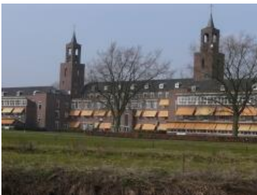
De klokkenberg te Breda