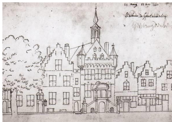
Schets uit 1729 van het stadhuis van Geertruidenberg door C. Pronk.

gemaakt waardoor wij nu kennis kunnen nemen van hoe ons erfgoed er driehonderd jaar geleden uitzag.