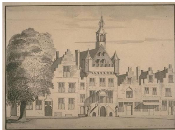
Nettekening uit 1729 van het stadhuis van Geertruidenberg door C. Pronk.