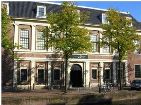
Rijksmuseum van Oudheden aan het Rapenburg

Allereerst worden we door de bus gebracht naar het Rijksmuseum van Oudheden, het nationale centrum voor archeologie, waar we gastvrij onthaald worden met koffie/thee en lekkers in het museumcafé, de zogenaamde Tempelzaal, waar meteen al een echte Egyptische tempel valt te bewonderen.