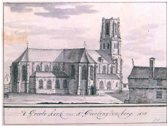
Onjuiste weergave (harsenschildering) uit ± 1722 door Jacobus Stellingwerf van de N.H.-kerk.

begin van de 19 e eeuw met betrekking tot de vernieling van de toren van de huidige N.H.-kerk. De lezing werd afgesloten met een aantal modernere voorbeelden uit beide categorieën. Bas heeft met zijn lezing een tipje opgelicht van de sluier die over een merkwaardig deel van het grote scala aan Bergse tekeningen ligt.