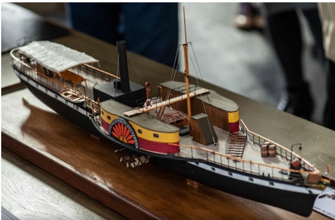
Het model De Stad Geertruidenberg II