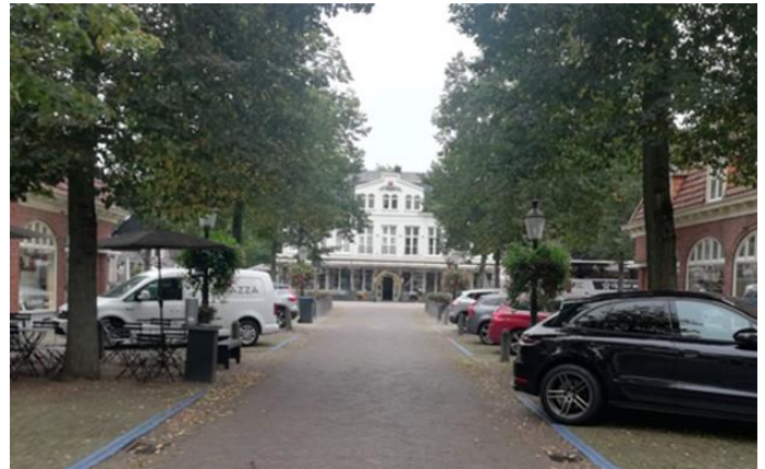
Restaurant Wapen van Rijburg

De eerste plaats van aankomst was in Driebergen-Rijsenburg, en wel bij Restaurant Wapen van Rijburg. Bij aankomst werd ons gezelschap geconfronteerd met de nieuwe maatregelen van de regering: de Coronacheck.