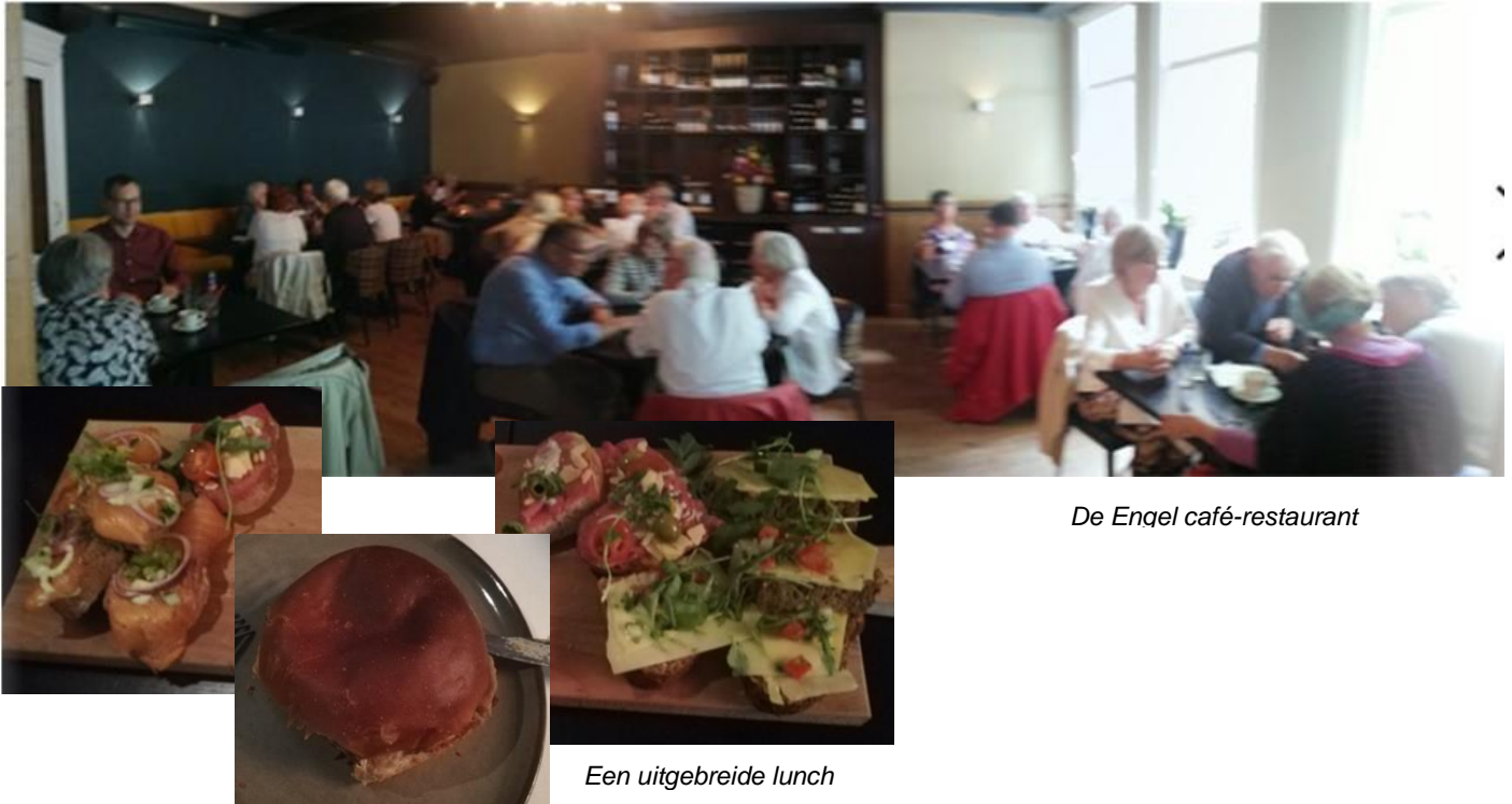
De Enqel café-restaurant