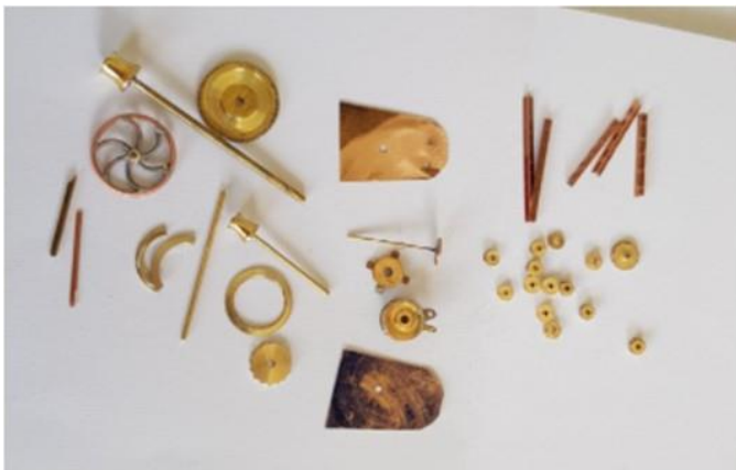
De ankerlier is geheel van brons en messing gemaakt. Alle tandwielen zijn op schaal met de juiste tanden. Het zou bijna kunnen werken.

Besloten is een z.g. stokanker op het dek te leggen met een davit die het anker overboord kan zetten. Via een kluisgat gaat de ketting naar de ankerlier.