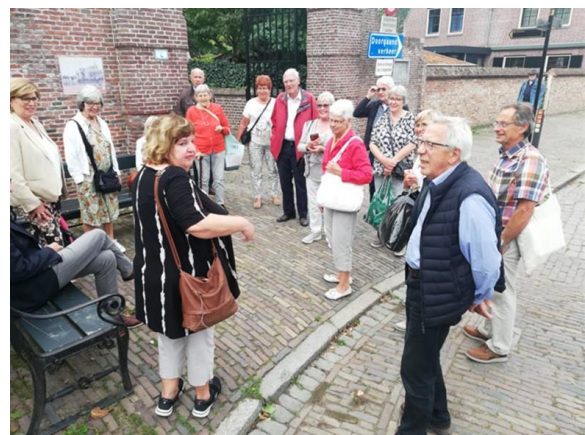
Een van de gidsen voor de ingang Kasteel Duurstede

de luxe touringcar verliep in aanvang spoedig, doch wegwerkzaamheden veroorzaakte een kleine vertraging van een drie kwartier. Dit heeft zeker de pret niet kunnen drukken want, ondanks het verplichte mondkapje, werd er nog volop (na)gepraat over de excursie dag en de "nieuwjes en oudjes" uit onze eigen mooie gemeente Geertruidenberg.