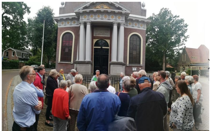
De st Petruskerk, gelegen tegenover Het Wapen van Rijburg

Grote complimenten aan alle deelnemers, negentig procent had zich goed voorbereid. Ze konden het vaccinatiebewijs via de smartphone aantonen. Helaas werden de deelnemers, waarbij de app niet werkte of die een papieren vaccinatie bewijs hadden, niet toegelaten. Gelukkig bood het terras in het heerlijke najaarszonnetje een goede oplossing. De koffie/thee met gebak smaakten heerlijk.