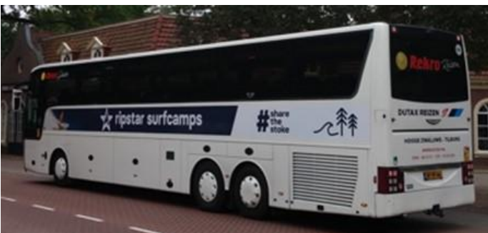
Vertrek met de touringcar Dutax reizen