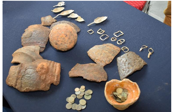
Een deel van de vondsten