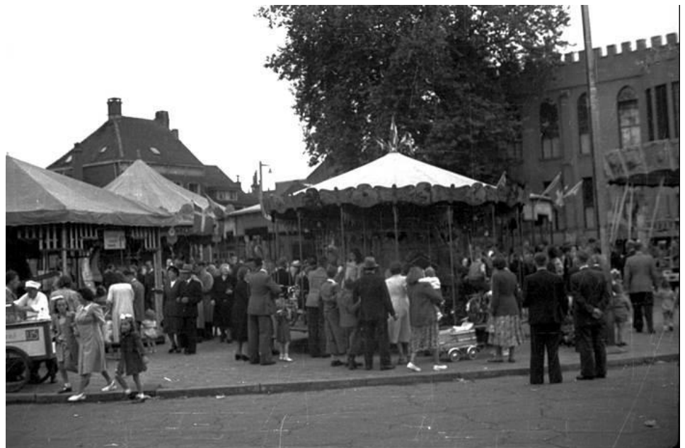
kermis Tilburg 1951

Loeff vertelt in zijn lezing onder andere over de verschillende attracties die vanaf de negentiende eeuw op de kermis verschenen; vanaf de allereerste attractie, de Mallemlen, passeren onder meer poffertjeskramen, schiettenten en stoomcarrouzels de revue. De kermisbranche is een hechte gemeenschap van vrije ondernemers, de kermisexploitanten, vaak families die al generaties lang op de kermis staan. De exploitanten woonden vroeger vaak in de attractie; rond 1900 kwam de woonwagen van zes of zeven meter lang in beeld, waarin een gezin van soms met meer dan tien kinderen in woonde. Tot begin van die eeuw kwamen kermisexploitanten meestal niet veel verder dan hun eigen provincie. De wegen waren te slecht om lange reizen te kunnen maken. Veel attracties werden nog met paard en wagen vervoerd, de grotere attracties vaak per binnenvaartschip. In Nederland zijn de oudste kermissen gehouden in Wijk bij Duurstede en enige tijd later in Utrecht. De eerste vermelding van een kermis in de Domstad dateert van 26 juni 1023, de dag dat de Sint Maartenskerk werd gewijd.