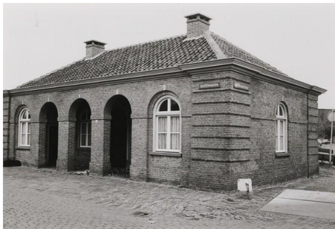
De oude wacht W. Muldersplein 1

Het Monumentenhuis Brabant biedt in samenwerking met de Rijksdienst voor het Cultureel Erfgoed en de provincie Noord-Brabant de mogelijkheid om ingrijpende restauratie- en herbestemmingsplannen voor rijksmonumenten vroegtijdig te bespreken. Meer weten volg deze link, http://www.monumentenhuisbrabant.nl/nieuws/ Zie hier ook, "Woonhuissubsidie vervangt fiscale aftrek voor particuliere eigenaren rijksmonumenten"