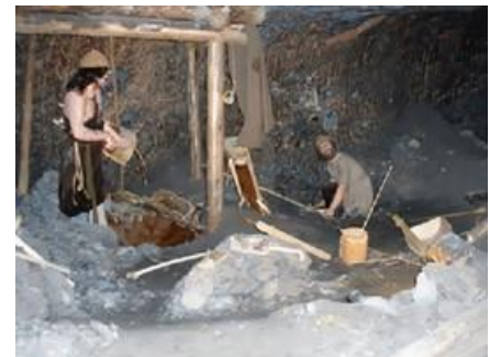
Impressie van een Keltische zoutmijn

Hallstatt (850-450 v.C.): sporen van Keltische cultuur vooral uit streek rond Hallstatt in de buurt van Oostenrijkse Salzburg ontdekten men een zoutmijn met gereedschappen, restanten van kleding en lichamen van ettelijke mijnwerkers.