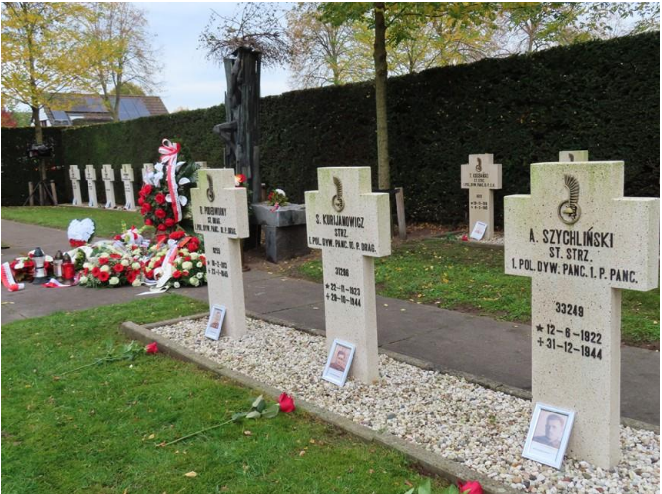
het Pools ereveld aan de Veerseweg in Oosterhout

Aan de Veerseweg in Oosterhout ligt het Pools ereveld met de graven van dertig gevallen Poolse militairen die gevallen zijn tijdens de bevrijding van onze streek in het najaar 1944. Deze soldaten maakten onderdeel uit van de Eerste Poolse Pantserdivisie onder leiding van generaal Stanislaw Maczek. Deze mannen waren tijdens de Nazi bezetting vanuit Polen gevlucht naar het buitenland en hadden zich vrijwillig aangesloten bij deze Pantserdivisie om Polen te bevrijden. Samen met andere geallieerde troepen trok de Eerste Poolse Pantserdivisie vanuit Frankrijk naar het noorden. In het najaar van 1944 slaagde deze eenheid er in om onze streek tot aan de Donge en de Amer te veroveren. Bij deze zware strijd waarbij ook Geertruidenberg werd bevrijd kwamen vele Poolse militairen en ook burgers om het leven. Dertig van de gevallen Poolse soldaten liggen begraven op het intieme Poolse ereveld op de begraafplaats aan de Veerseweg te Oosterhout.