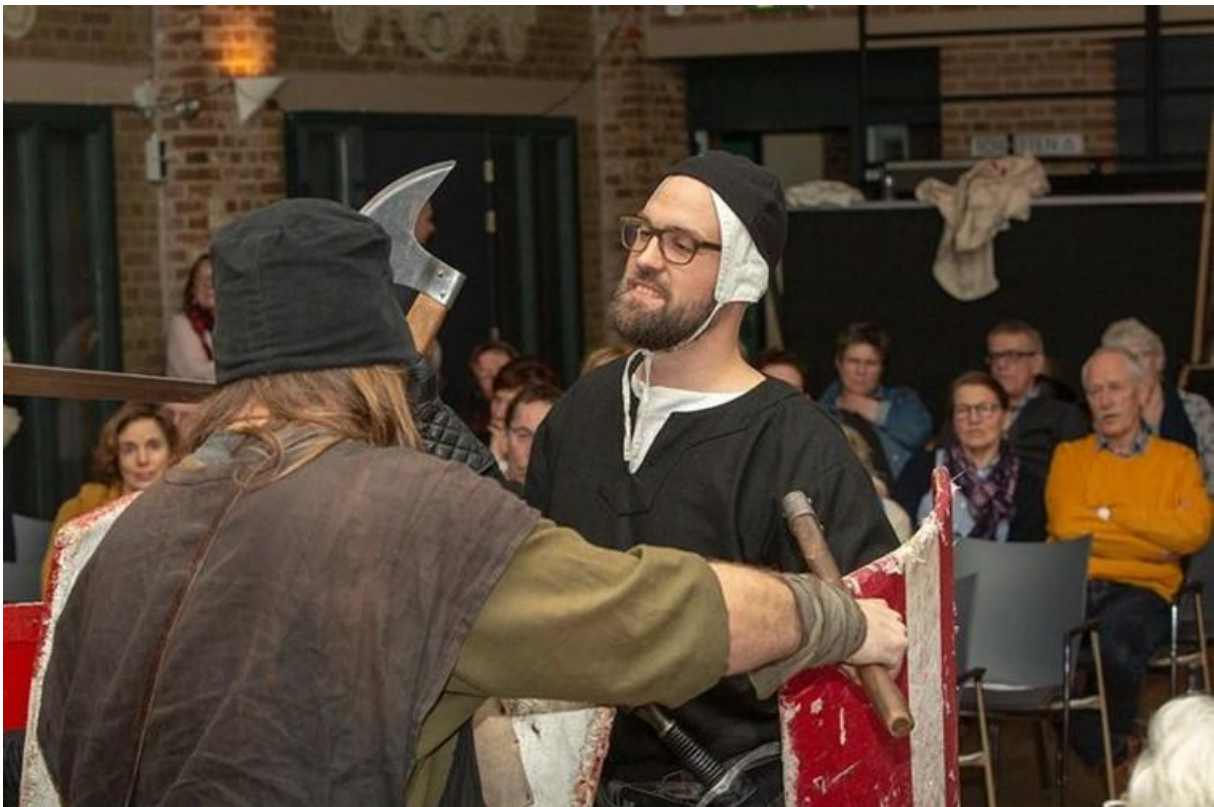
Expeditie Tempelier

De Orde van de Tempeliers bestond uit mannen die zowel monnik als ridder waren, vertelt Hopstaken. „Ze stredden aanvankelijk tegen de moslims in het Midden-Oosten, tijdens de kruistochten. Daarna richtten ze zich meer op Europa. Ze stonden onder toezicht van de paus, en waren alleen hem verantwoording schuldig. De Spaanse koning Filips de Schone was jaloers op de macht en invloed van de tempeliers, en verspreidde roddels en kwaadsprekerij.