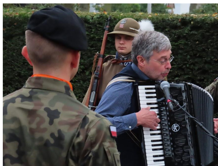
Gesneuvelde Poolse militairen werden herdacht