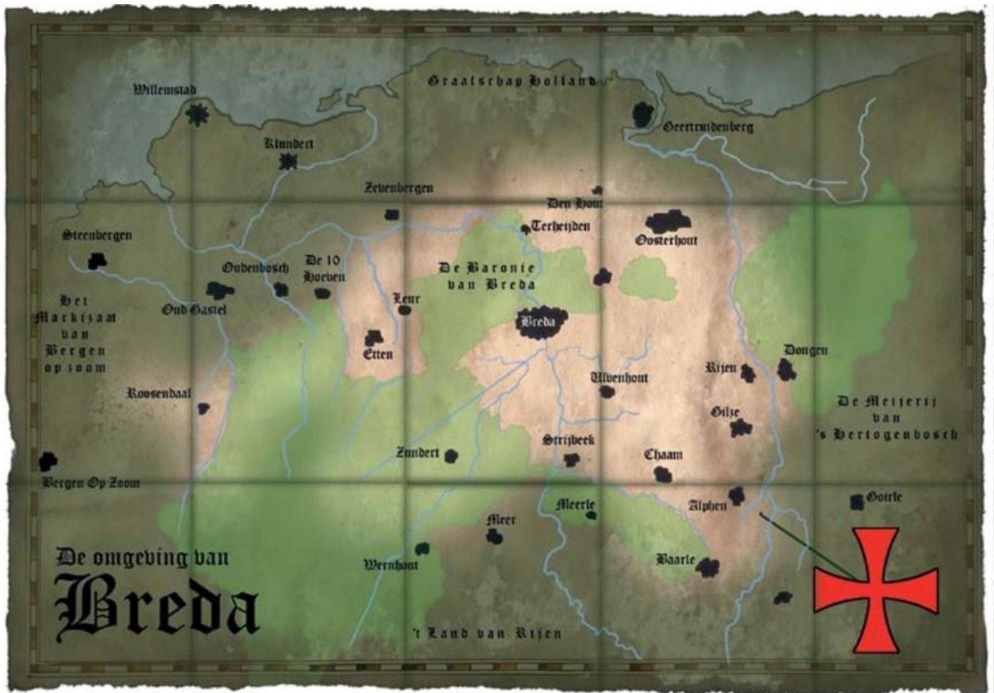
Een overzicht van commanderijen in de omgeving van Breda

Zij namen al hun kostbaarheden mee en daarmee werd de invloed van de Tempeliers in Europa sterker. Zowel in het Midden-Oosten als in Europa stichtten zij commanderijen. Soms waren het vestingen, soms was het slechts een hoeve. Veelal werden de commanderijen en bijbehorende landerijen geschonken door lokale edelen. Op de commanderijen werden inkomsten gegenereerd uit oogsten van de diverse landerijen, boomgaarden en veestapels. Ook werd er vanuit de commanderij handelgedreven met lokale bevolking. Met deze inkomsten financierden de Tempeliers hun vestigingen en acties in het Heilige Land. Aan het eind van de dertiende eeuw moeten er alleen in Europa al zo'n negenhonderd commanderijen zijn geweest. Maar de Tempeliers waren ook de eerste bankiers ter wereld. Pelgrims konden bij een commanderij hun geld afgeven. Daarvoor kregen zij dan een geldwissel die zij aan het eind van hun reis in Zuid-Europa of het Heilige Land bij een andere commanderij weer in konden wisselen tegen klinkende munt. Deze rol was niet gering.