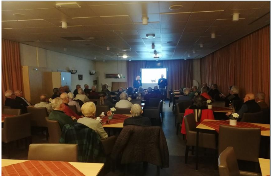
De voorzitter opent de lezing voor een goed gevulde zaal

De lezing eindigde met een korte samenvatting van de belangrijkste punten. De spreker benadrukte dat geloof en bijgeloof vaak naast elkaar bestaan en dat het belangrijk is om open te staan voor andere overtuigingen en hierover in gesprek te gaan. Na afloop was er nog tijd voor vragen en discussie, waarbij de bezoekers actief deelnamen. Het was een geslaagde avond waarbij iedereen nieuwe inzichten en inspiratie opeedde.