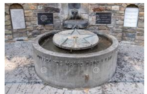
afb wonder banneux geneeskrachtig water

Leef mee met de eerste patiënten met syfilis in Nederland.