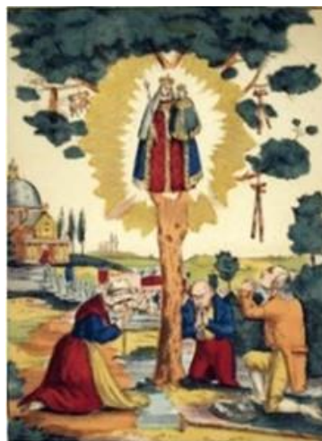
afb wonder lamme genezen krukken in bomen water

Deze lezing is een aanvulling uit onverwachte bron op zijn vroegere vondsten. In "Wonderen in het Zonlicht" worden door hem de raakvlakken tussen de geneeskunde en de vele wonderen uit de periode 1300 tot 1750 beschreven.