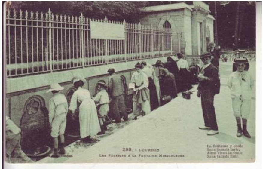
afb wonder watertap in Lourdes

Die beloftes varieerden van het doen van bedevaarten met als enige voedsel water en brood tot het schenken van kostbare afgietsels van genezen lichaamsdelen in zilver of kaarsenwas.