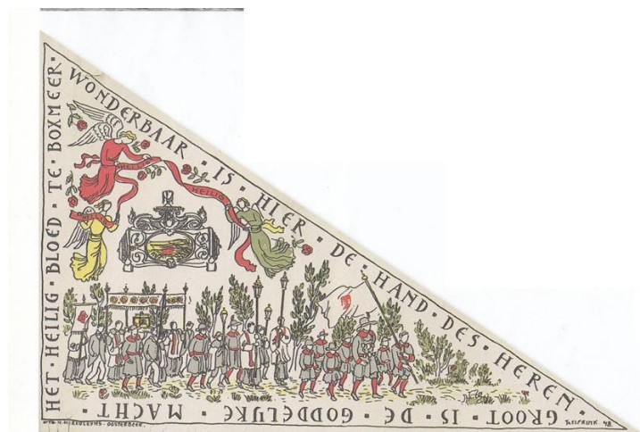
afb wonder boxmeer bedevaartvaantje