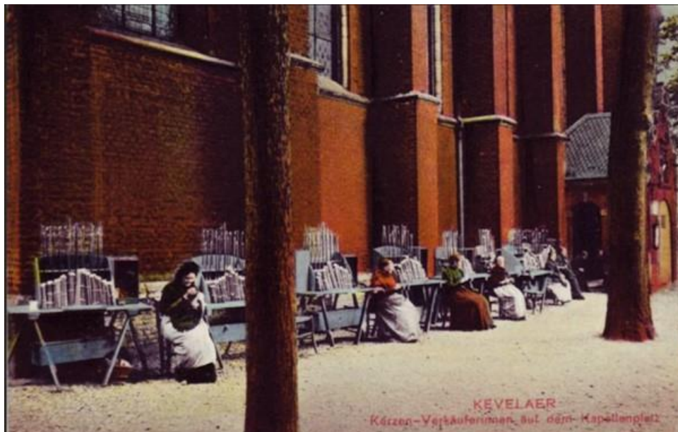
afb wonder kevelaer kaarsenverkoopsters

kinderen naar een Heilige en het verschijnsel wisselkind. Hans laat U op boeiende wijze luisteren naar het leven in een andere wereld.