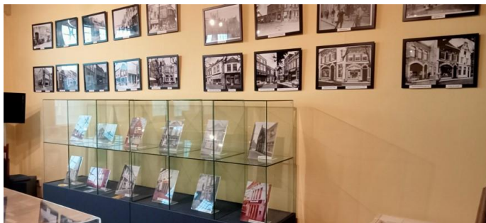
Geertruidenberg winkels en horeca van

Tezamen met bioscoop 'Centraal' had Geertruidenberg een rijk uitgaansleven.