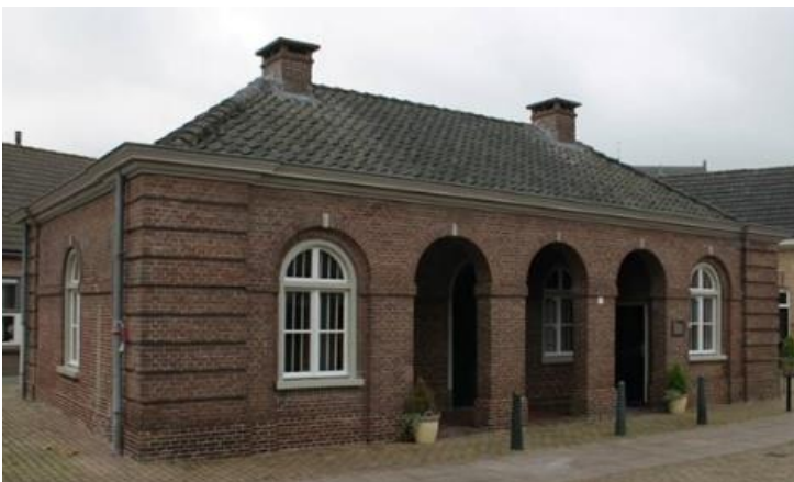
De "Oude Wacht" toekomstig onderkomen OKG

Mogelijk kunnen we ook een beroep doen op de waterscouting "De Mafeking" dat vraagt coördinatie.