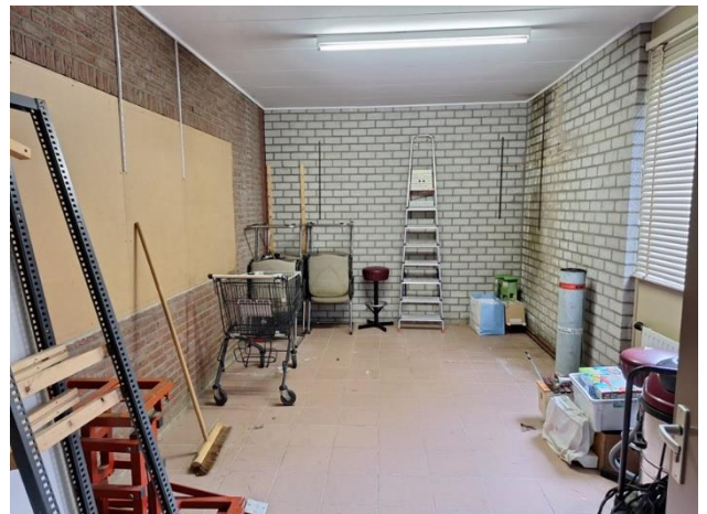
Voorlopige opslagruimte "De Schelf" te Raamsdonksveer